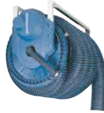
電動式排気ホースリール