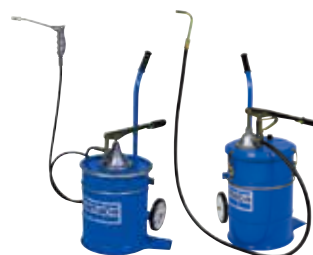
グリース用/オイル用ハンドバケットポンプ