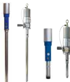
ドラムポンプ/サイホンポンプ