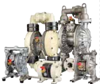
ダイヤフラムポンプ