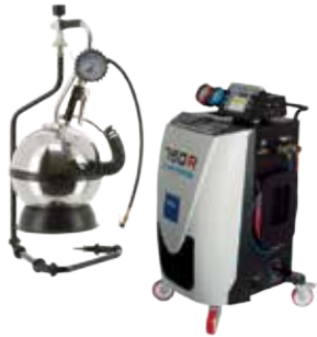
エアキャリー／フロンガス交換機