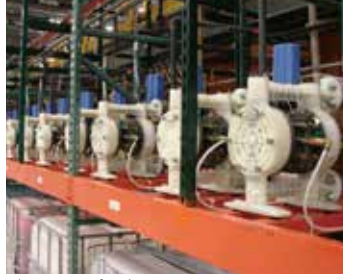
ダイヤフラムポンプ