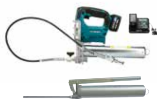
電動式グリースガン/ハンドグリースガン