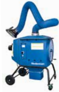
溶接ヒューム・微細粉塵回収装置