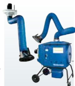
作業環境改善機器事業