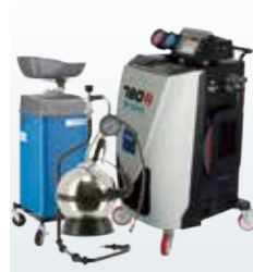
カーメンテナンス機器事業