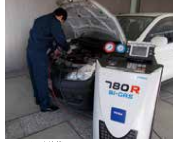
フロンガス交換機